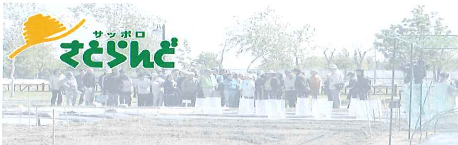
野菜栽培集合研修会の様子