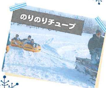
のりのリチューブ