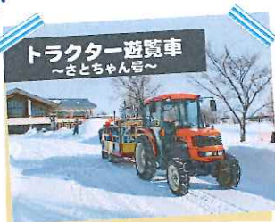
トラクター遊覧車 ～さとちゃん号～