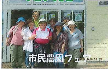
市民農園フェスティバル