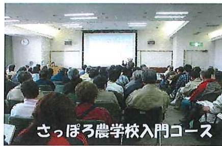
さっぽろ農学校入門コース